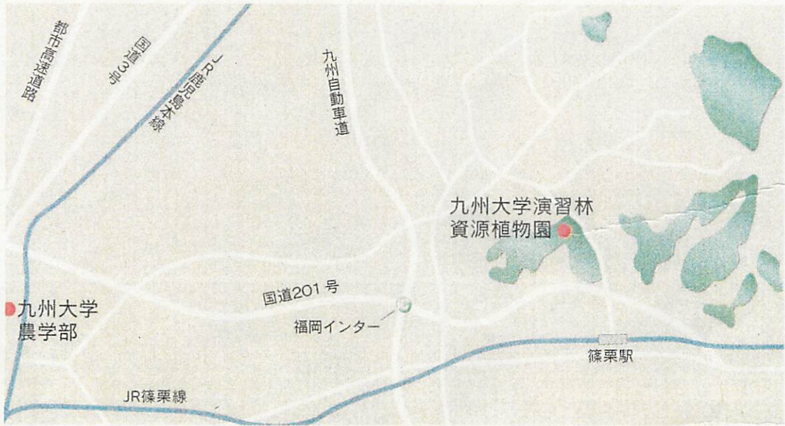
図1 演習林の位置図-1